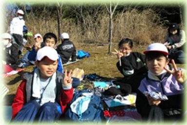
みんなで一緒においしいお弁当。

5年生による2泊3日の観音山自然体験が行われました。子供たちは、勇気をもって自然の中に飛び出し、知恵をしぼり、仲間と協力して3日間を過ごしました。集団での宿泊体験を通して、たくましくなって帰ってきました。