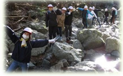
沢登りに挑戦！大きな岩も乗り越えました。