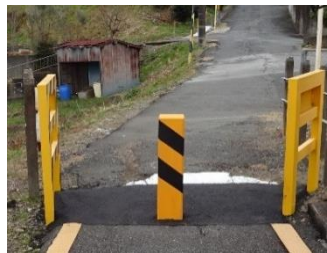
2列で通れるようになりました。

これで、登校時の渋滞が緩和され、スムーズに踏切を渡ることができるようになりました。