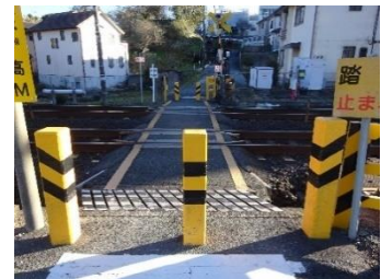
踏切の北側出入口は2列。

令和5年1月9日（月）にJR能光寺踏切の改修工事が行われ、南側出入口が2列通行できるようになり、また滑り止めも施工されました。安全な踏切のために御尽力していただいた地元の小野田自治会の皆様、JR東海の関係者の皆様、ありがとうございました。