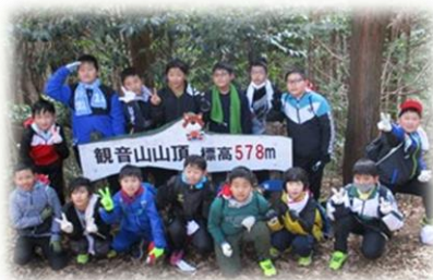
観音山(578m)登頂に成功！