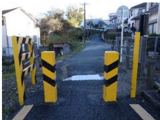
踏切内で渋滞が発生していた南側出入口。