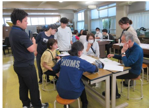
職員研修(授業に関する勉強会)の様子