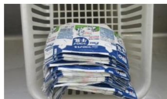
きれいに揃えられた牛乳パック