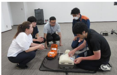
職員研修(心肺蘇生法の勉強会)の様子