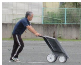
朝一番で、体育の準備をする様子