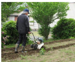
学習で使う畑の土を耕す様子