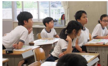
自分から一生懸命話を聞いたり、考えたりする子供たち