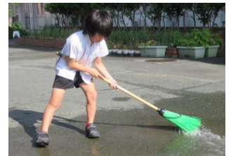
自分で気づいてみんなのために行動する様子