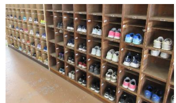
靴のかかところが揃えられた靴箱