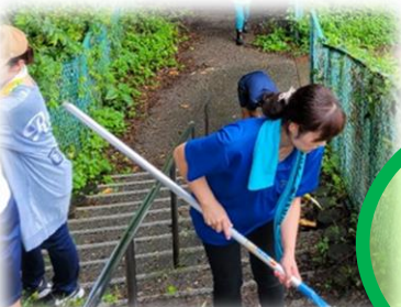
校地環境美化ボランティア