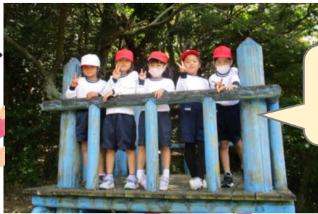
リニューアル前の展望台