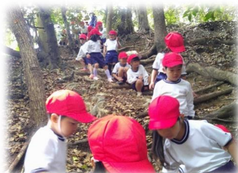
学校山で遊ぶ子供たち