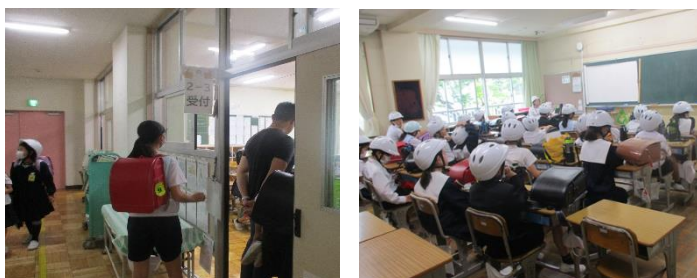
校舎内での引き渡しは、初めての試みでした